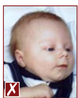
Photo de profil