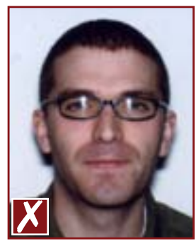
Reflets dans les verres