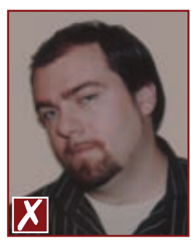
Photo trop sombre