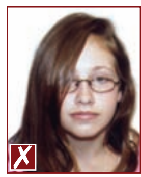
Cheveux couvrant les yeux