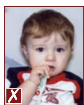
Présence d'un objet dans la photo