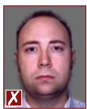
Arrière-plan de couleur