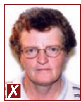
Présence d'ombres à l'arrière-plan