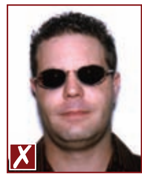
Verres teintés foncés