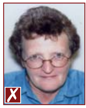
Monture qui cache les yeux