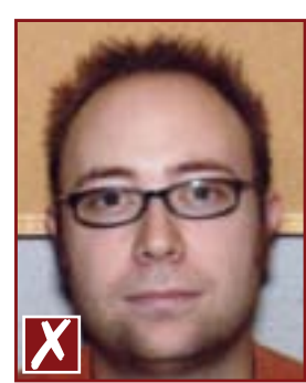
Présence d'un objet à l'arrière-plan