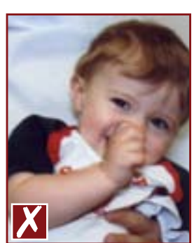
Présence de mains dans la photo