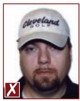
Port d'un chapeau