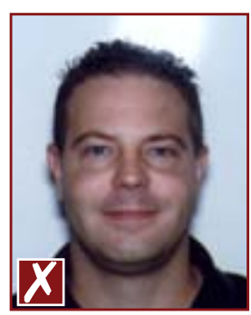
Reflets sur le visage